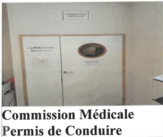
Commission Médicale Permis de Conduire