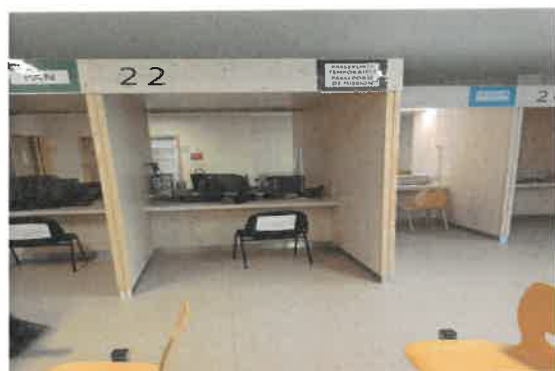
Passeports temporaires – de mission