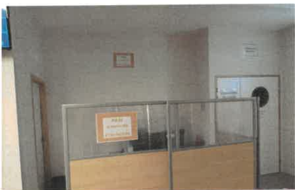
PAN e-meraude Etrangers