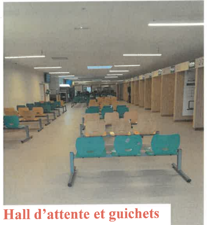
Hall d'attente et guichets