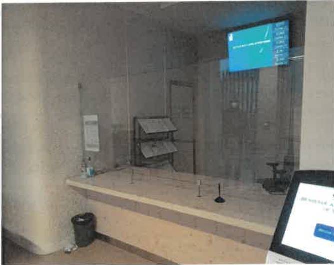
Point d'informations générales