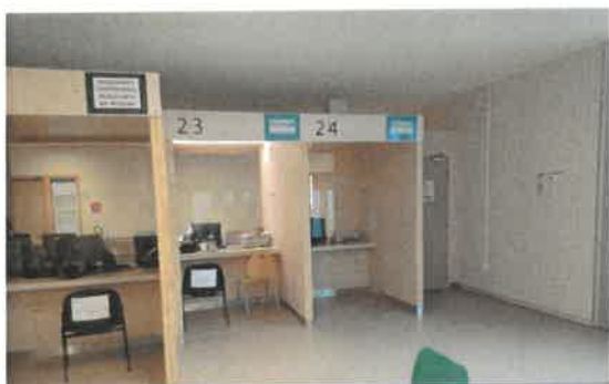
Guichets Retrait de titres - séjour